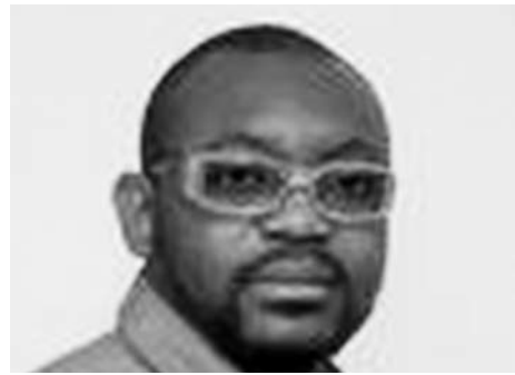
Jean-Pierre Bekolo – cinéaste- « C'est le système qui avait un problème »