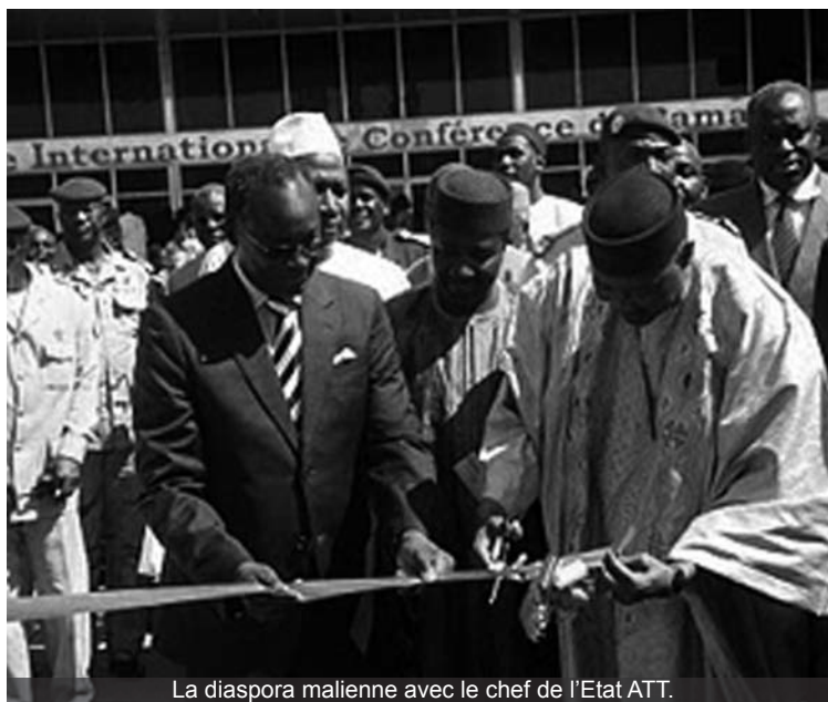
La diaspora malienne avec le chef de l'Etat ATT.