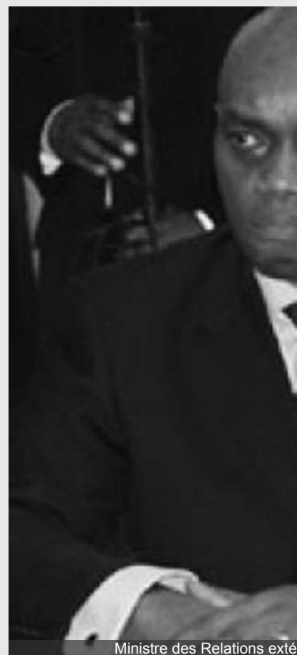
Ministre des Relations extérieures.